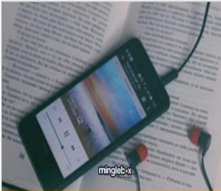
AICTE to implement Open Book Examination in Technical Institutes